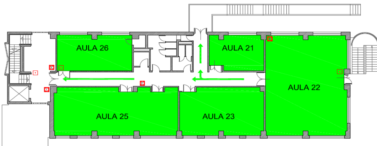
Planimetria Aula Magna Polo di Agraria, Blocco A1 (via San Camillo De Lellis, s.n.c. – Viterbo)