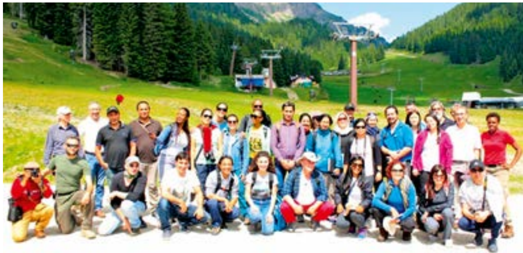
Il gruppo in visita a Paneveggio

ti da tutto il mondo. L'ultima sera di permanenza in Tesino il gruppo ha partecipato alla Festa dei portegghi, così tutti i partecipanti al corso hanno festeggiato insieme ai compaesani di Cinte e dintorni in un bel clima di festa.