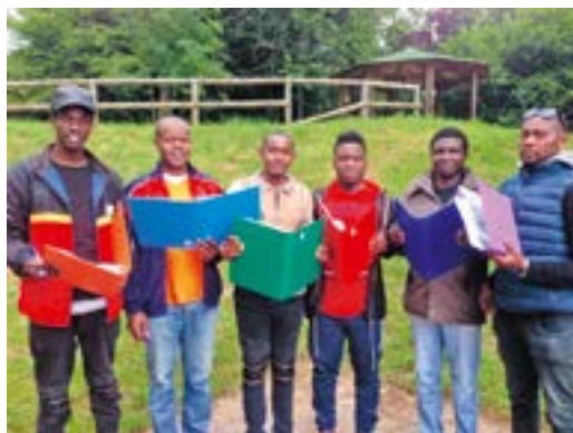
I partecipanti del corso "in campo"

promuovendo il recupero dei terreni incolti e delle colture antiche e il contenimento delle aree boschive.