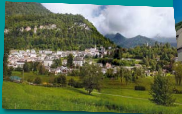
Immagine attuale di Pieve con foto recente della Chiesa dell'Assunta